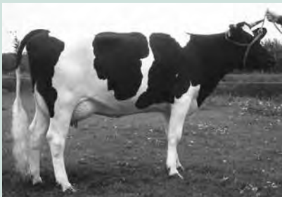
dochter Sjoukje 280