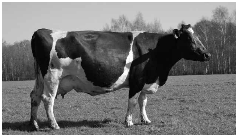
De negen jaar oude Corrie 9, dochter van Rivelino 162. Levensproductie: 50.000 kilo melk met 4 procent vet en 3,46 eiwit. “Elk jaar kalven, en steeds in een keer drachtig.”

De Leuvenumse Holsteins waren van een ander productiekaliber, maar