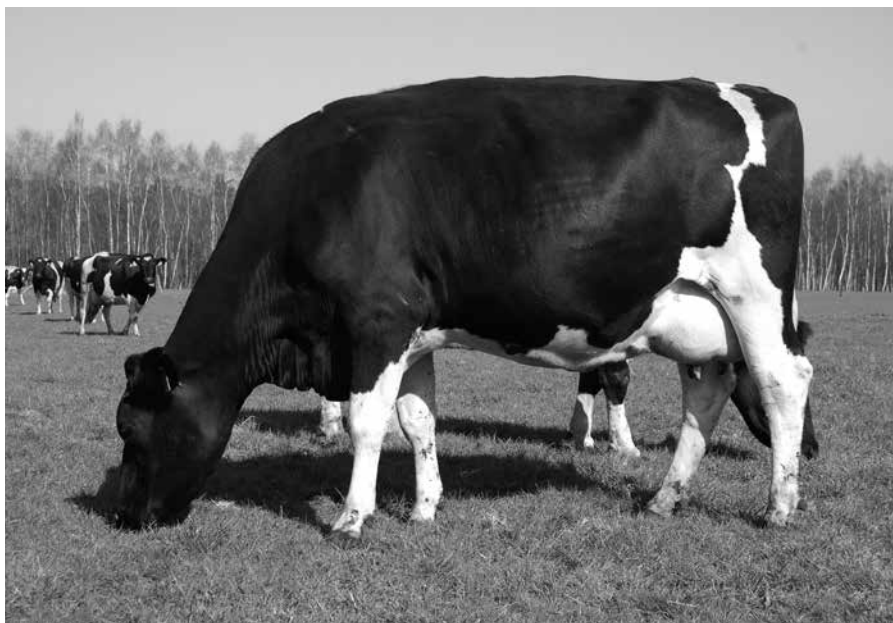
Margreet 18, een dochter van Rivelino 441 uit een Jabot, oftewel een 50% Holsteinkruisling. “Hier wil ik wel een stier van”, aldus de fokker.